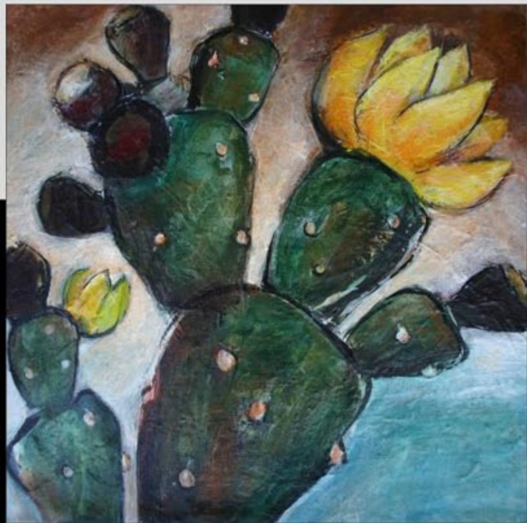
BARBARIE FLEURIE 60 X 60 CM