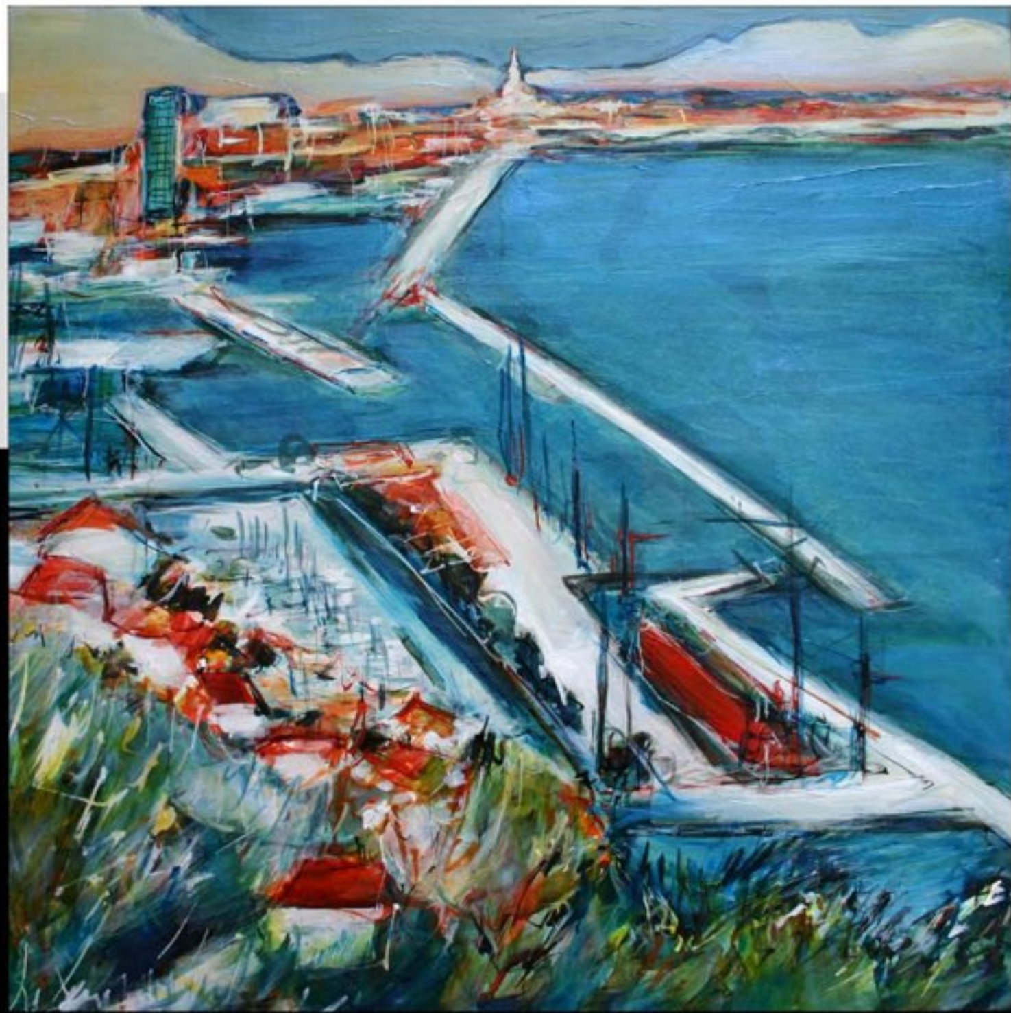
DE L'ESTAQUE AUX GOUDES 80 x 80 CM