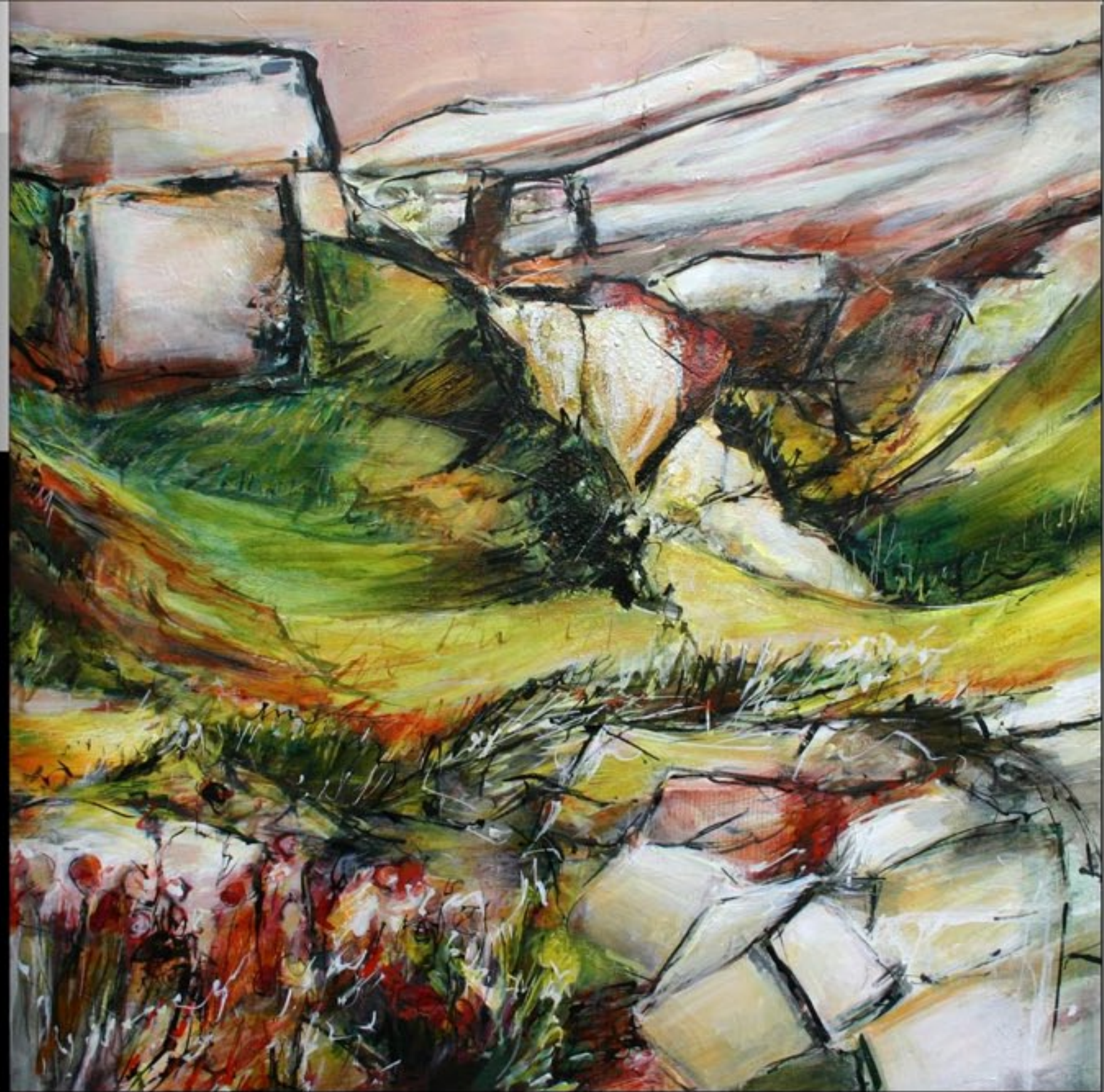
LE CHEMIN DES PEINTRES : PIERRES DE L'ESTAQUE 100 x 100 CM