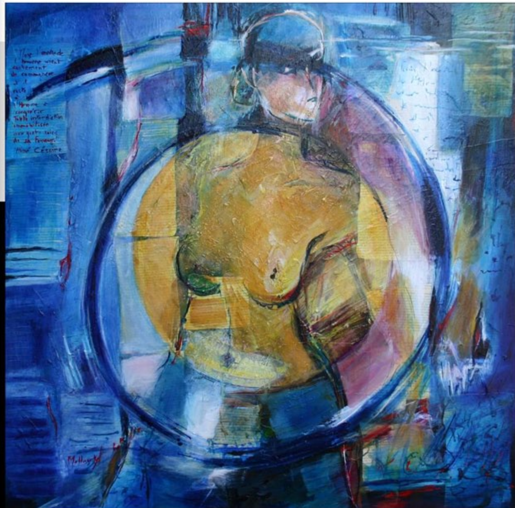
VERS LA LUMIÈRE II : "MAIS L'OEUVRE DE L'HOMME VIENT SEULEMENT DE COMMENCER ..." 80 x 80 CM

l'homme à conquérir Toute interdiction immobilisée aux quatre coins de sa ferveur." Aimé Césaire