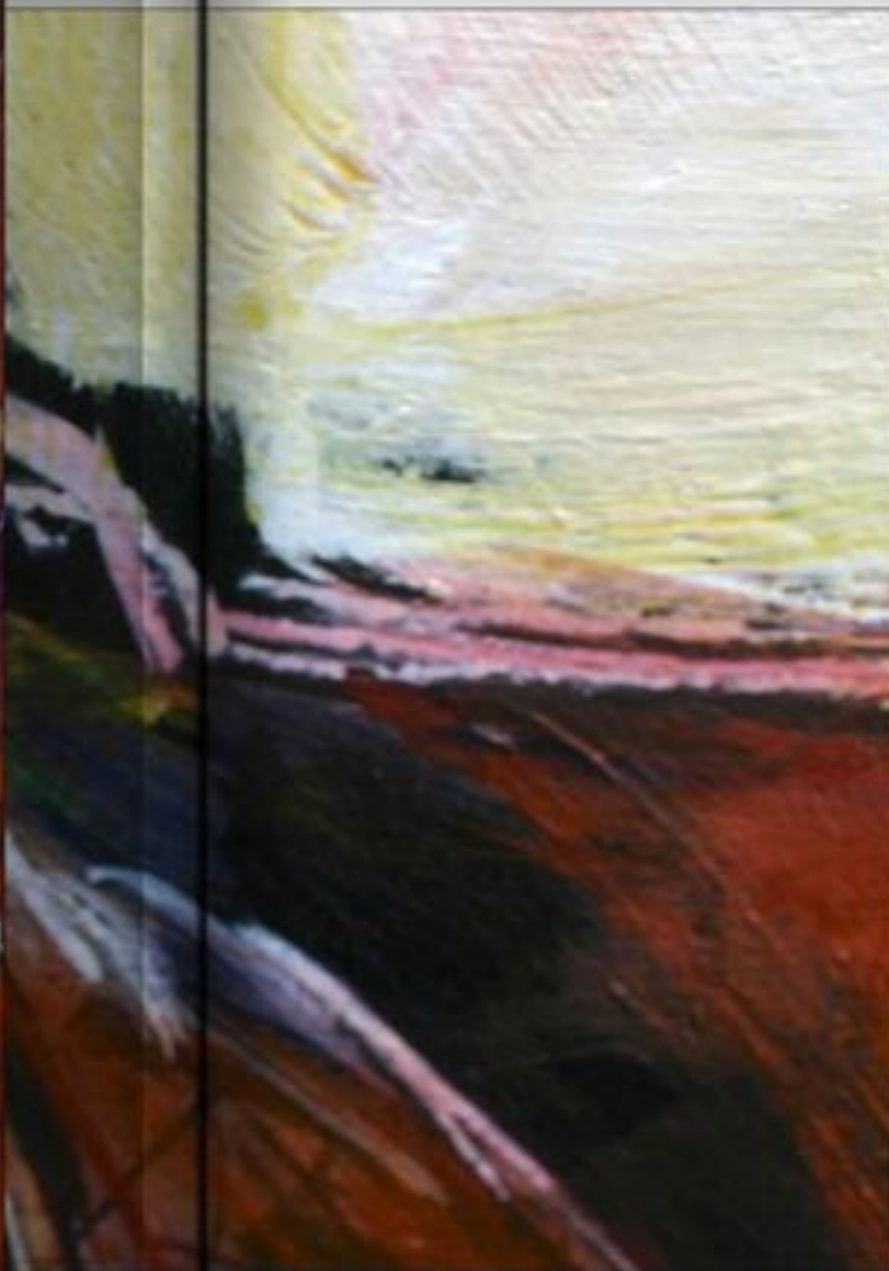
HORTENSIA I 73 X 50 CM