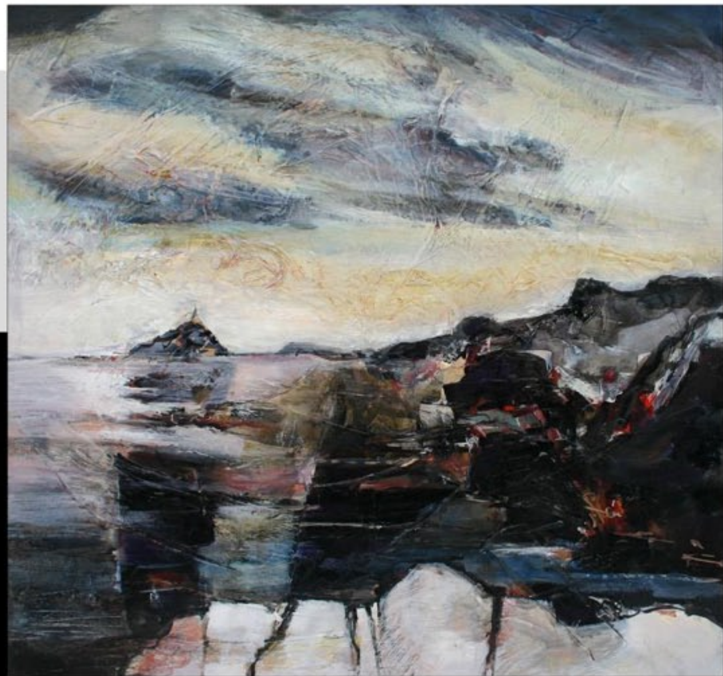
CALANQUE DE CASSIS 50 x 50 cm