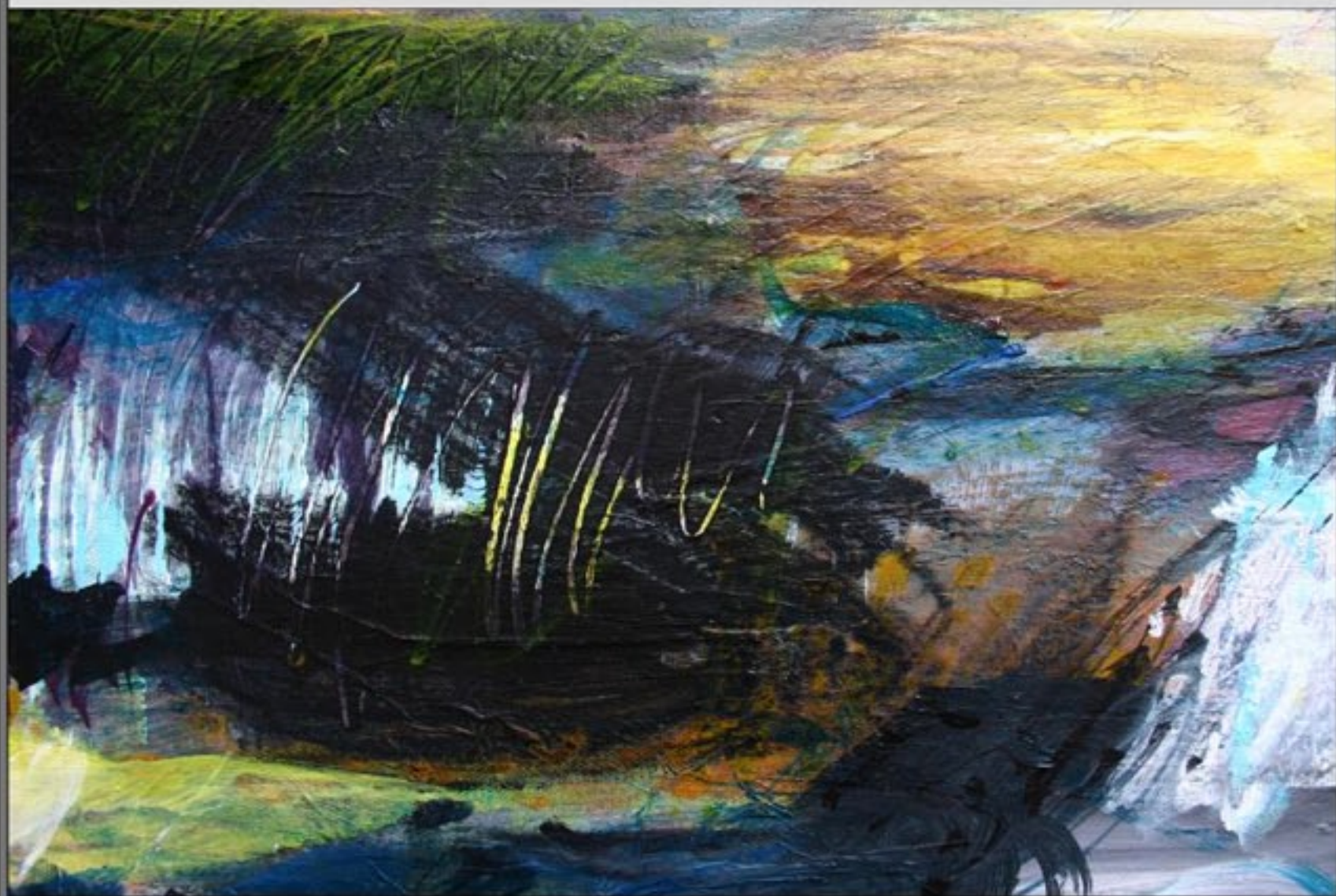
VERS AUDIERNE 100 X 100 CM