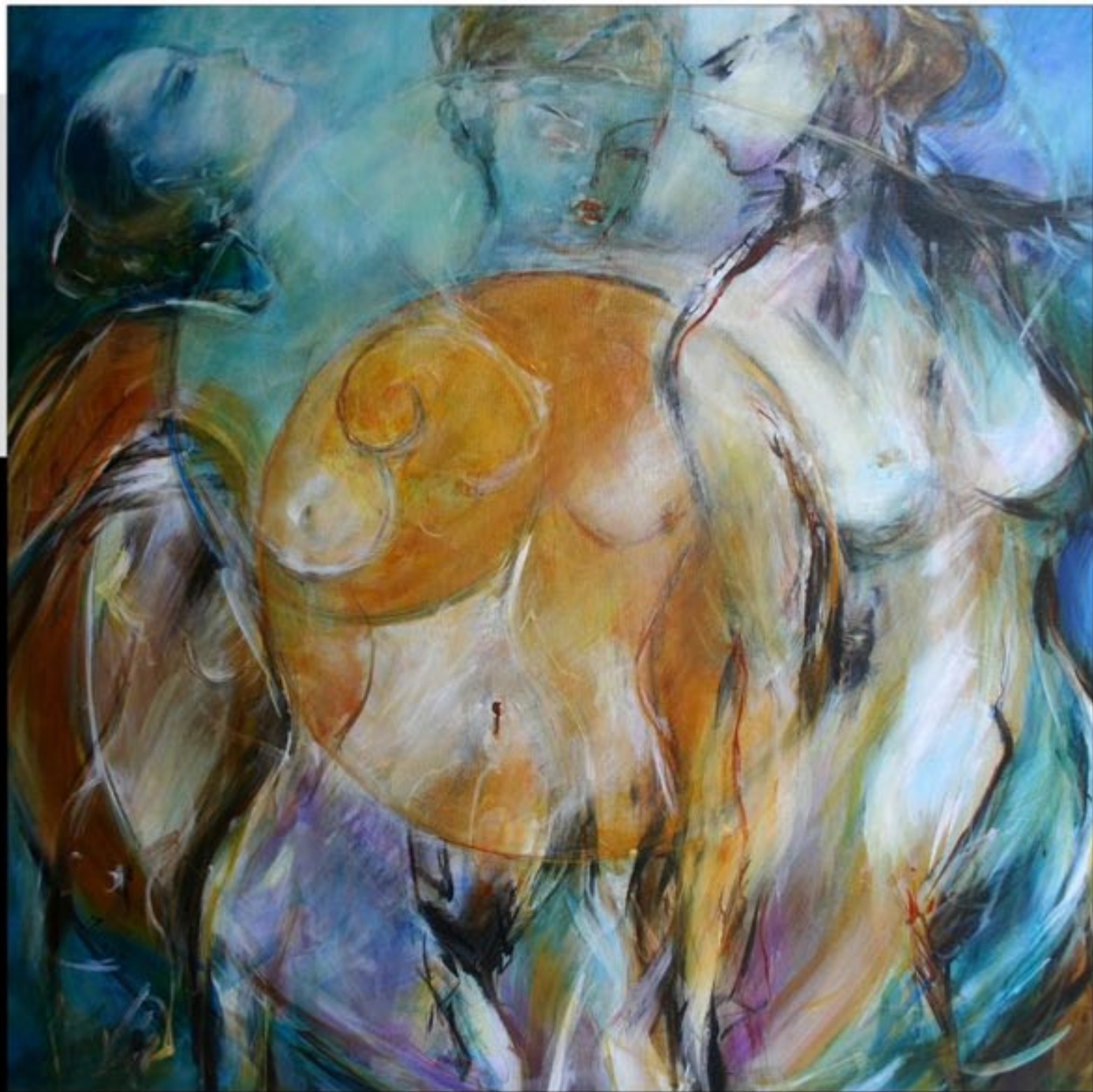
VERS LA LUMIERE III : LES TROIS MUSES 80 x 80 CM