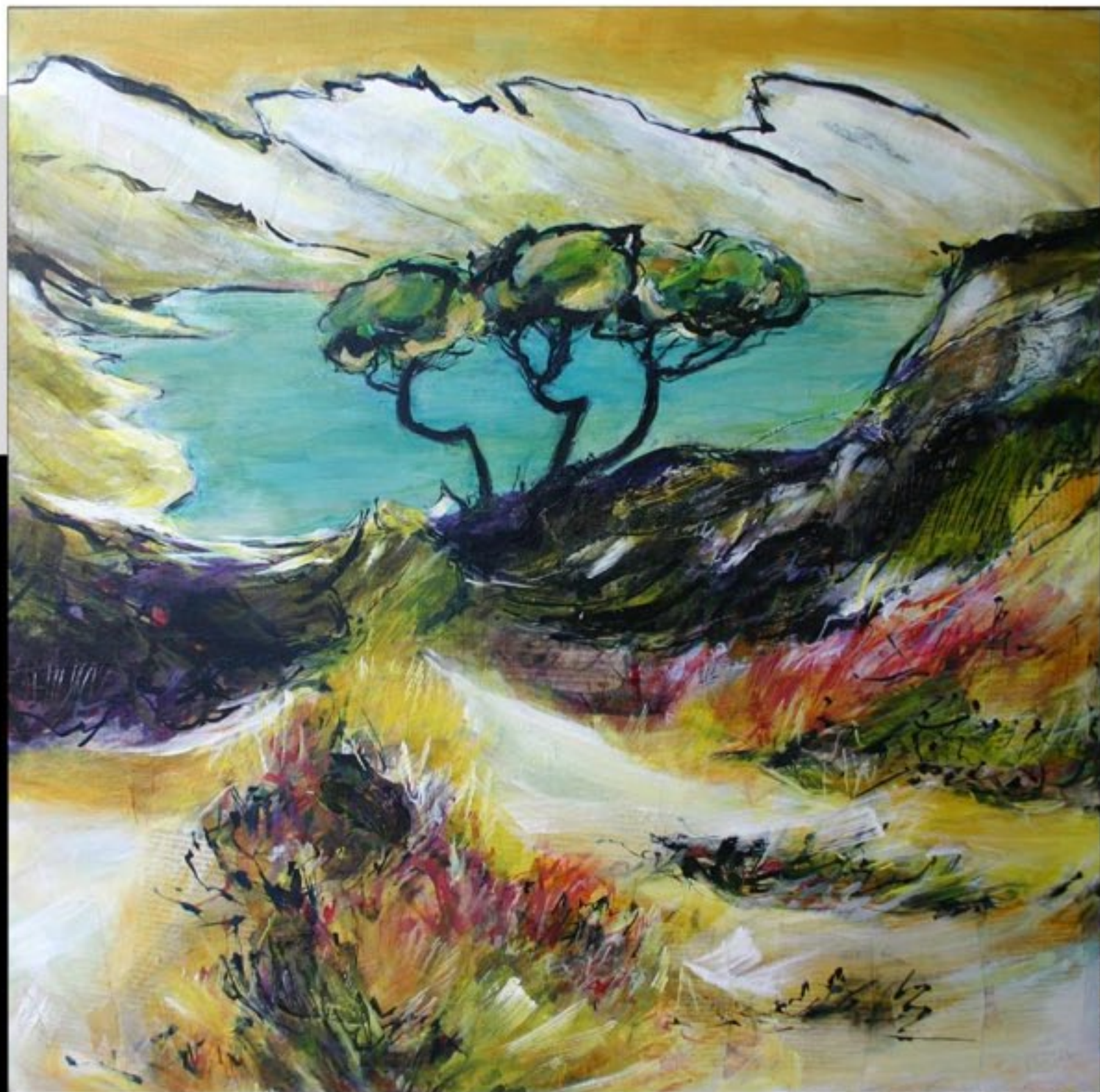
LES TROIS PINS DE LA CRINE 80 X 80 CM