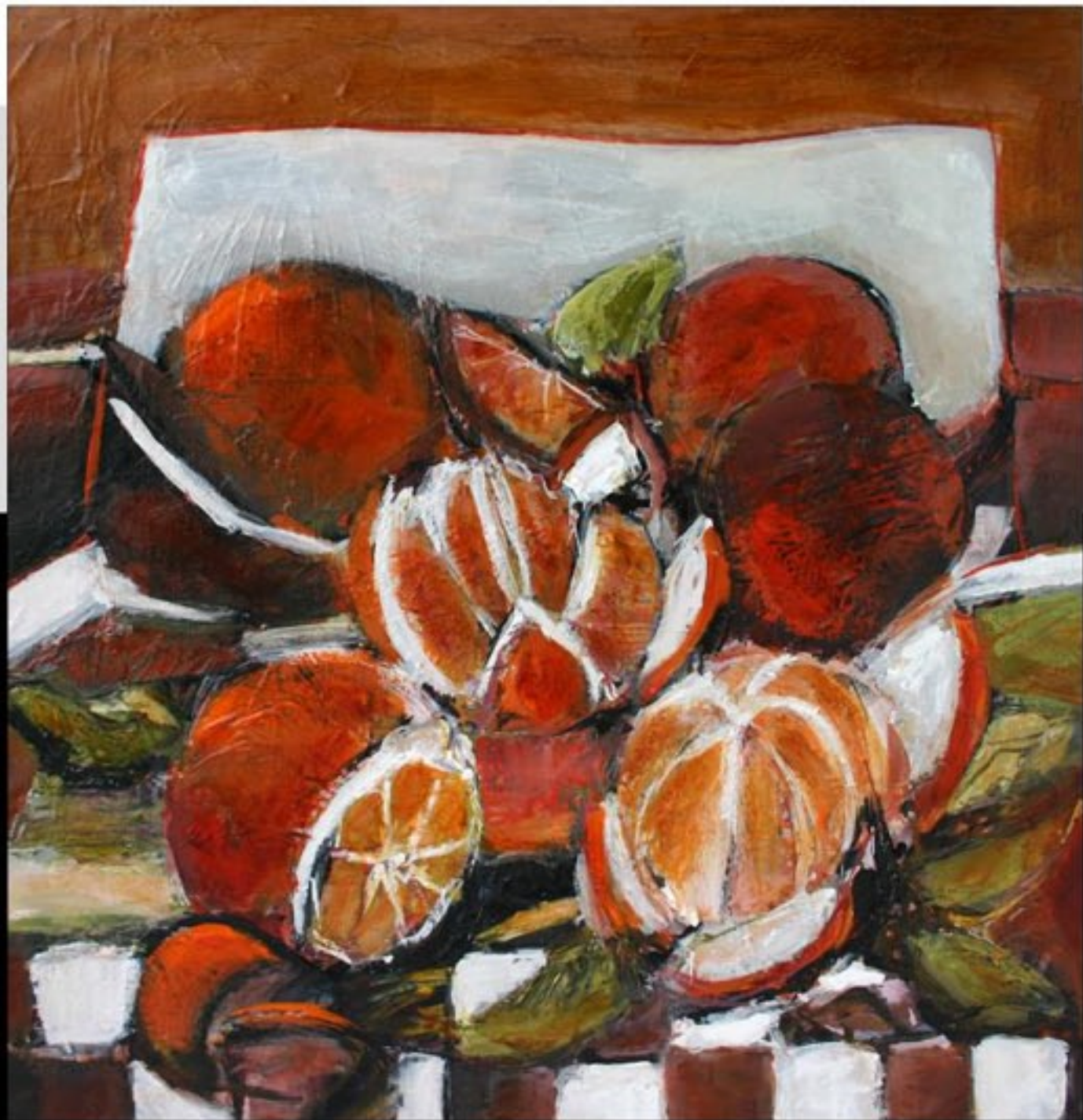
ORANGES, ORANGES 60 X 60 CM