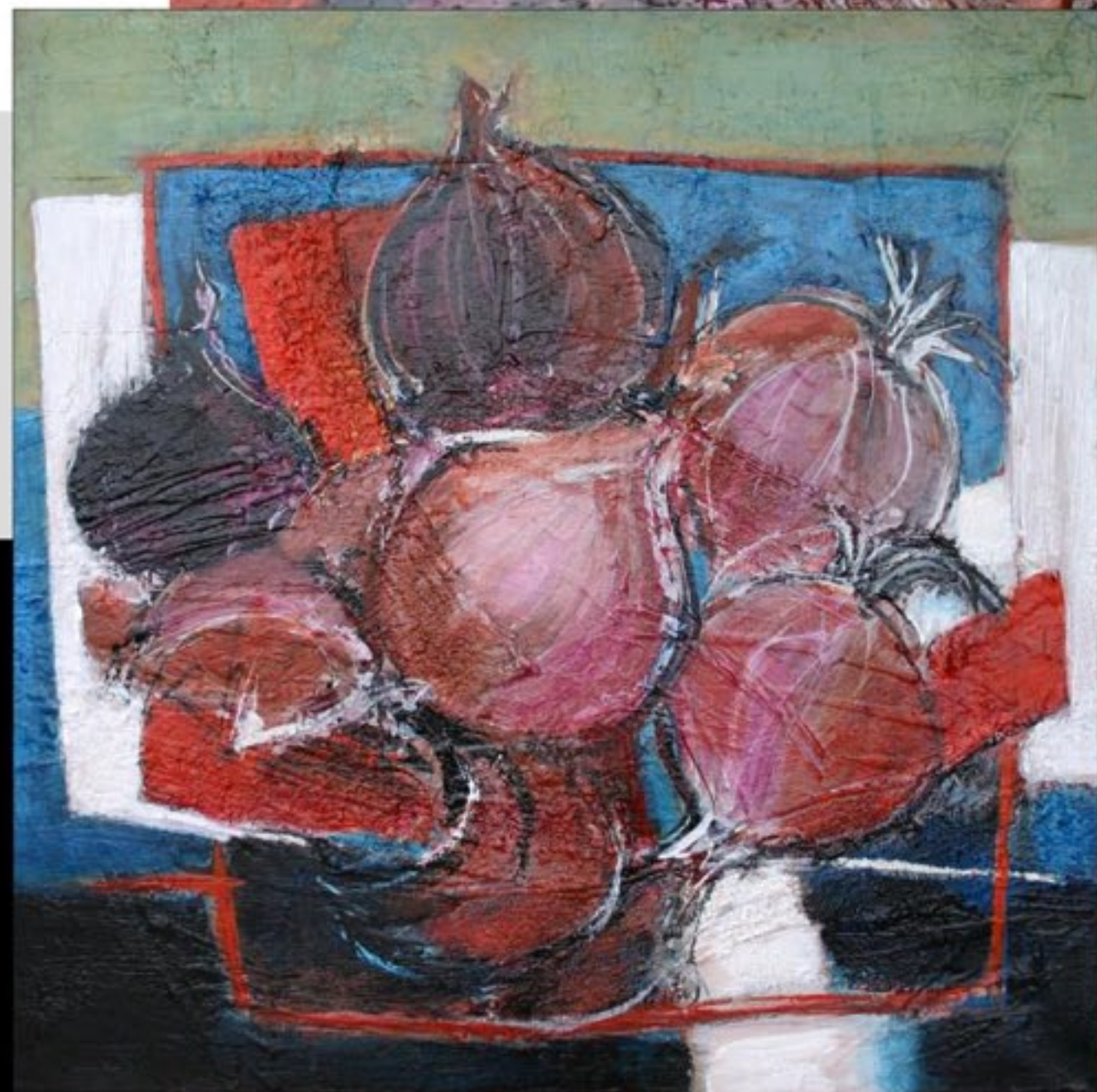
ROSES DE ROSCOFF 50 X 50 CM