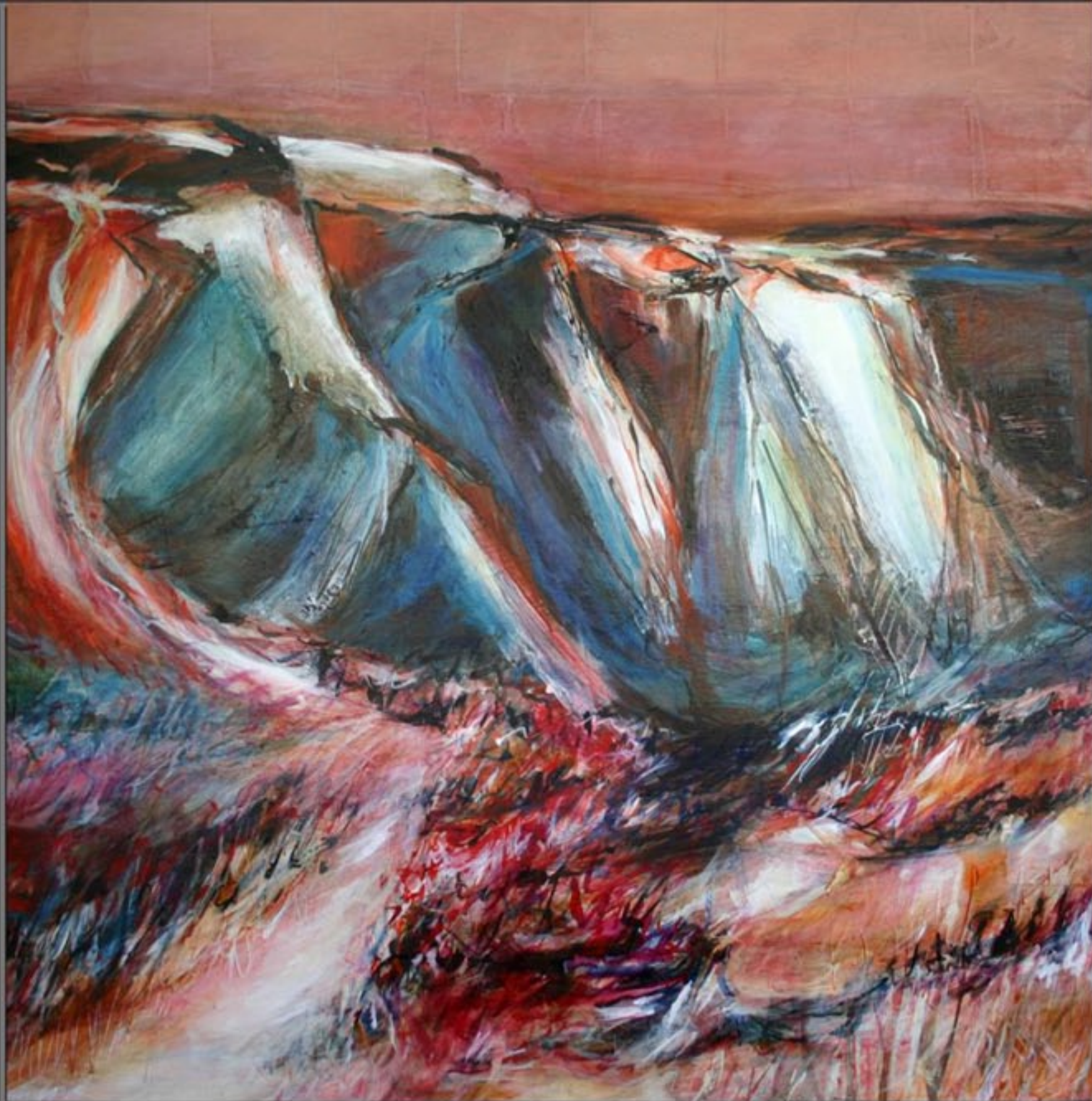
CAP CANAILLE 100 x 100 cm