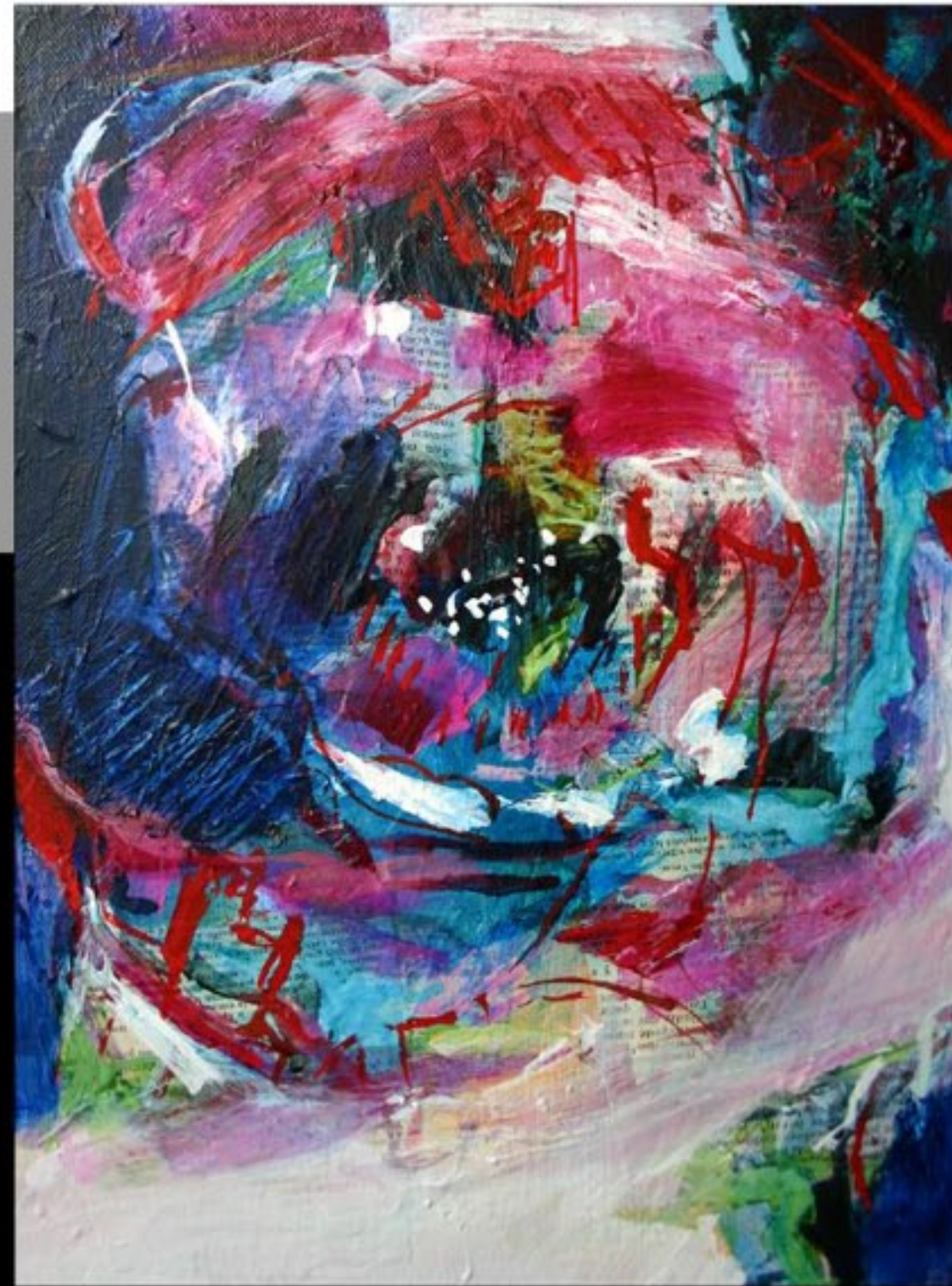
PIVOINE I, II ET III 33 x 24 CM