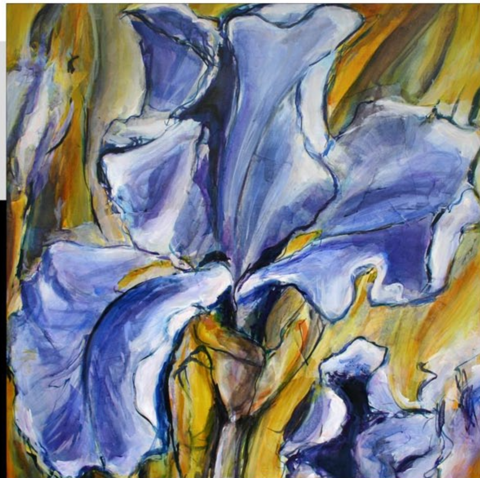
IRIS BLEU 80 x 80 CM