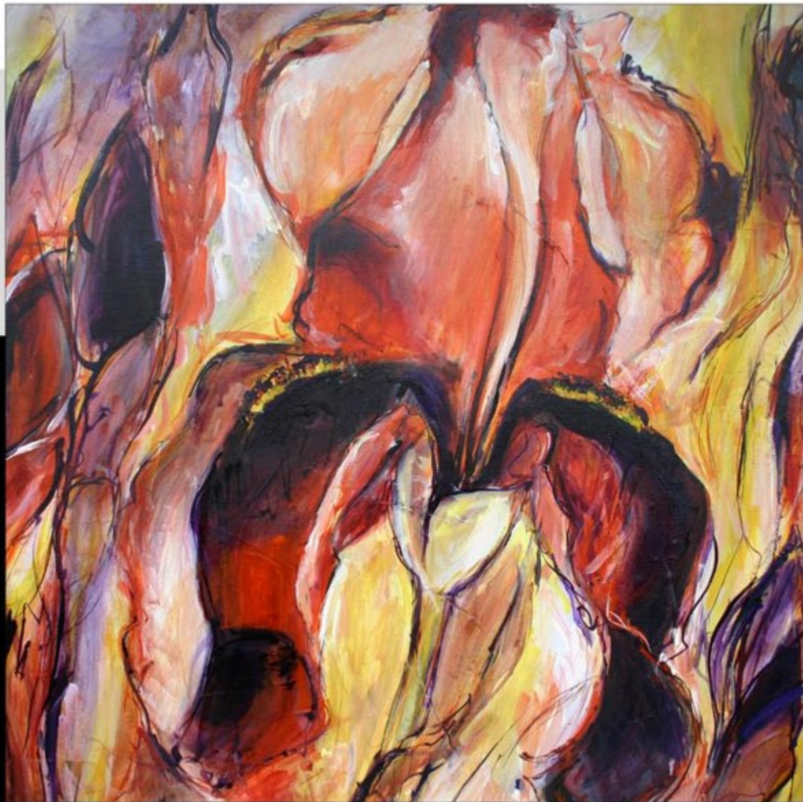
IRIS BRUN 80 x 80 CM