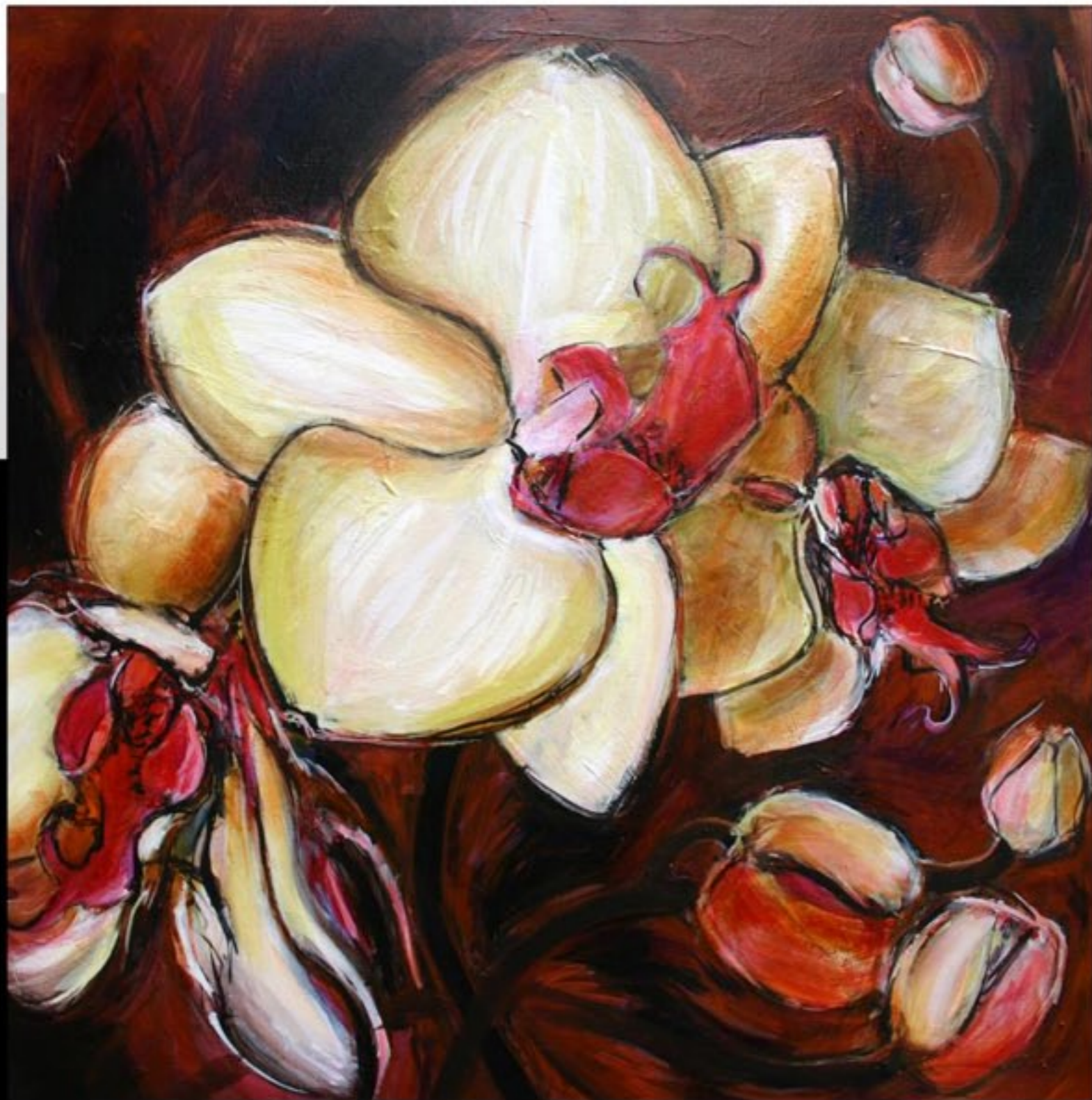
ORCHIDÉE I 80 X 80 CM